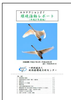
(一財)新潟県環境分析センター