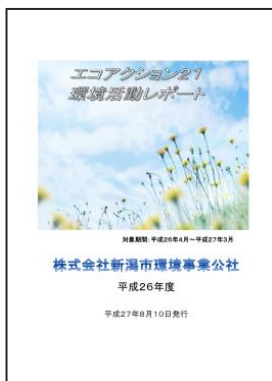
株式会社新潟市環境事業公社